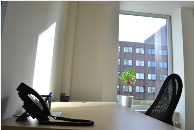
Coworking Space 1: Ein Arbeitsplatz 295,00 €/mtl.