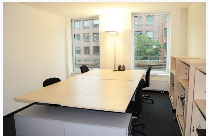
Coworking Space 4: Vier Arbeitsplätze 995,00 €/mtl.