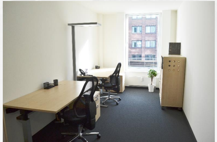
Coworking Space 2: Zwei Arbeitsplätze 595,00 €/mtl.